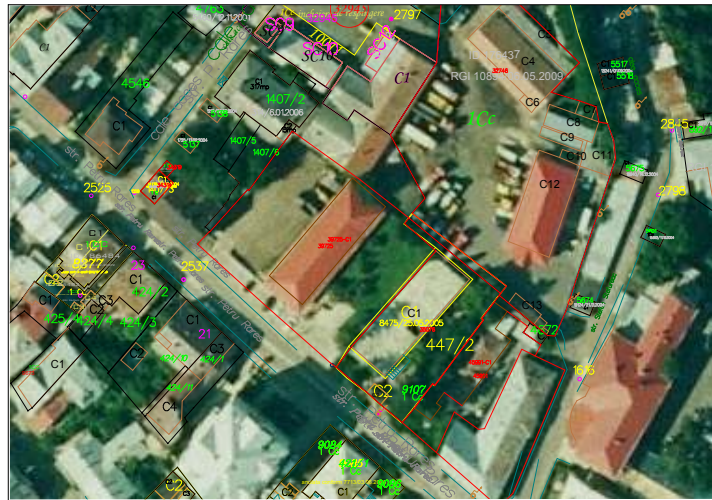
EXTRAS ORTOFOTOPLAN SC.1:1000